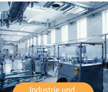
Industrie und Handwerk

Umfassende Oberflächenreinigung in verschiedenen professionellen Bereichen.